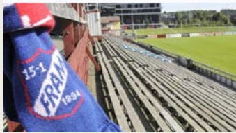
Bry Deg Prosjektene

IF Fram Larvik Fotball - Skape, styrke og videreutvikle lokale fellesskap og fritidstilbud gjennom å aktivt skape plasser unge mennesker har lyst til å være. Bry deg prosjektet – for gutter og jenter i alderen 6-25 år. Det handler om sosialt samvær, aktivitet og mestring! Kort fortalt er prosjektene lavterskeltilbud – tilbud om gratis aktivitet – rettet mot barn og unge i Larvik og omegn. Bry Deg prosjektene skal gi positive ringvirkninger for deltakerne og hele lokalsamfunnet ved å bidra til aktivitet, deltagelse, tilhørighet, kompetanseheving og verdiskapning.